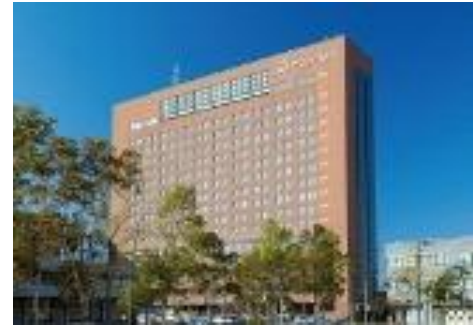
釧路プリンスホテル