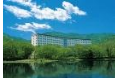
屈斜路プリンスホテル