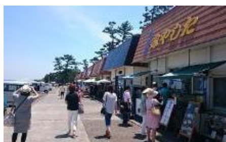
新鮮な魚介が味わえる食堂街