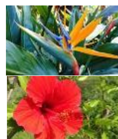
極楽鳥花とハイビスカス