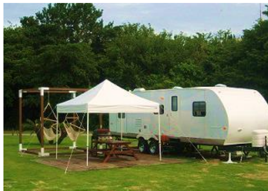
トレーラーヴィラ

広々としたフローリングの室内に、ふかふかのマットレス。まるで自宅のリビングのようにくつろげます。