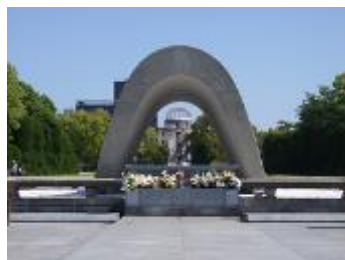
原爆死没者慰霊碑