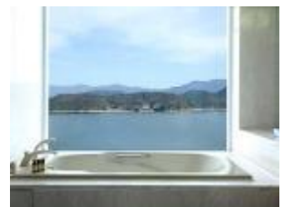
プレミアムリゾートフロア「波」 スイートルーム 5 ベッド