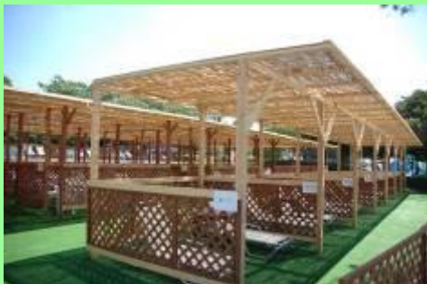
プライベートビレッジ