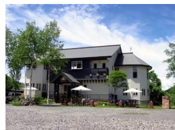
ペンション・リージェントハウス