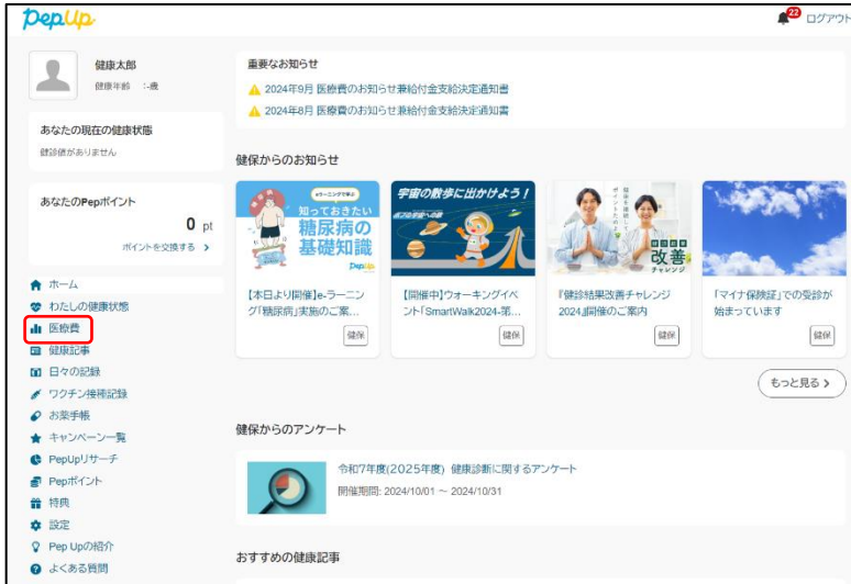
ホーム画面(パソコン)